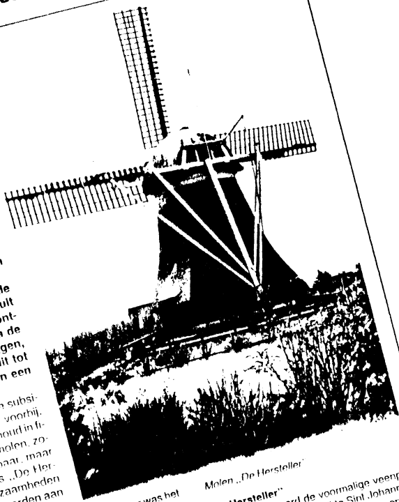
Molen „De Hersteller“